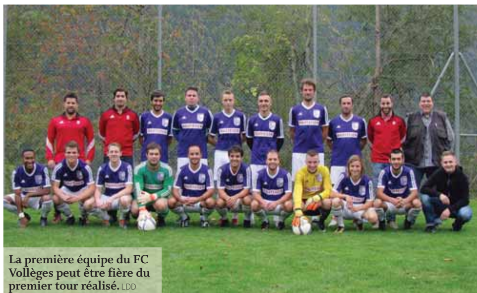
La première équipe du FC Vollèges peut être fière du premier tour réalisé.