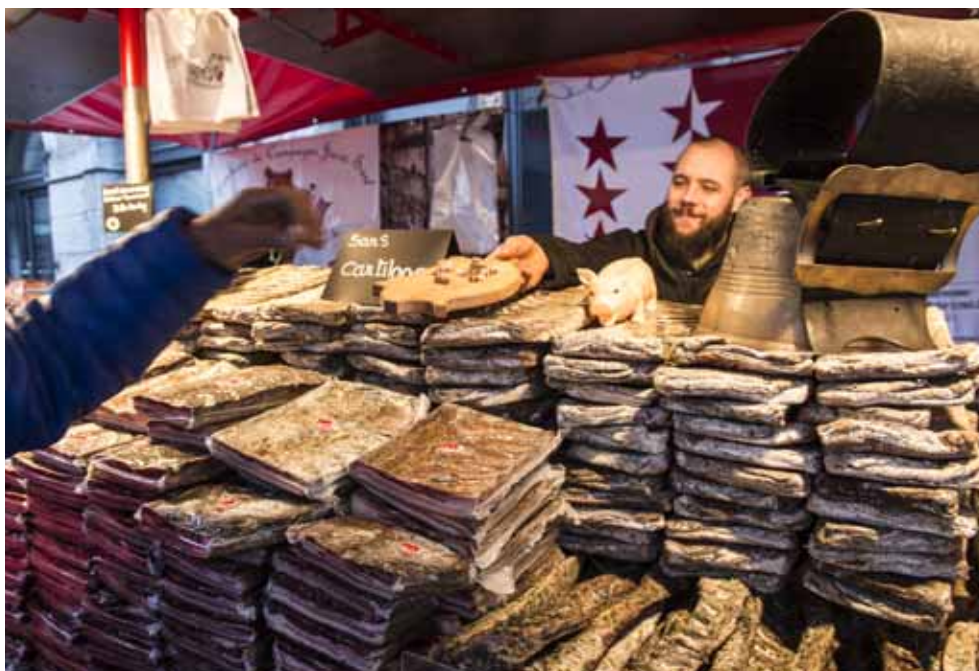
De quoi mettre les papilles en émoi... LDD