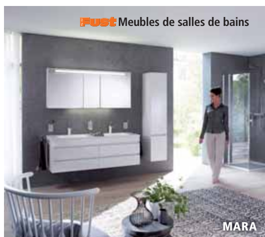
Meubles de salles de bains issus d'ateliers suisses.