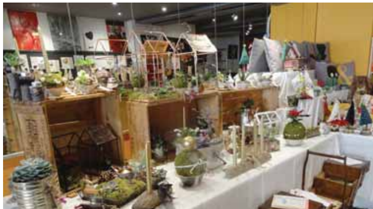
Créations artistiques, objets utiles originaux, produits du terroir ou bios, le marché de Noël d'Evionnaz se réinvente chaque année.

Les particularités de ce marché, qui a désormais fait sa place dans la région, sont d'une part celle de réunir non pas des commerçants, mais des particuliers passionnés, et d'autre part celle de vendre uniquement des produits artisanaux. «Tous les exposants ont à cœur