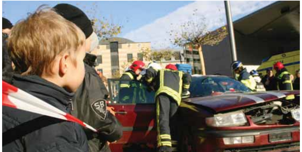
Les sapeurs-pompiers feront une série de démonstrations dans le cadre du Téléthon.

Avant ce rendez-vous du samedi 9 décembre qui mobilisera quelque 60 pompiers de Martigny et environs sur la place Centrale, une vente est organisée dans les grandes surfaces de la