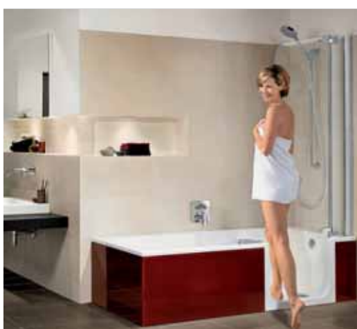
Twinline – douche et baignoire en un.