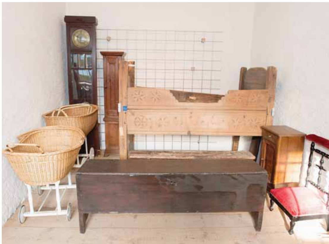
C'est à un voyage dans le temps que vous invitent les patoisants de la vallée du Trient. HÉLOÏSE MARET

La première étape a été la mise en œuvre d'un site internet et d'un dictionnaire en ligne du patois de la vallée. La deuxième, prévue pour 2018, est l'édition et l'impression à tirage limité du dictionnaire illustré qui doit faire référence parmi les ouvrages déjà édités dans le canton. Avec plus de 800 pages et une cinquantaine de dessins re-