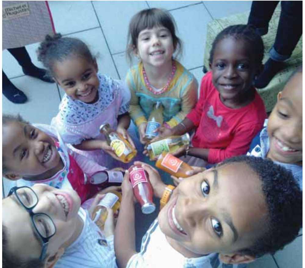
Lors d'une fête d'anniversaire sur le thème «Chez Opaline» organisée par SoSo animations.