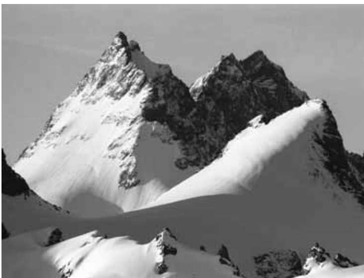
Une collection d'œuvres en noir et blanc qui rendent hommage à la majesté du milieu alpin valaisan. SÉBASTIEN ALBERT

Librairie le Baobab jusqu'au 27 janvier 2018.