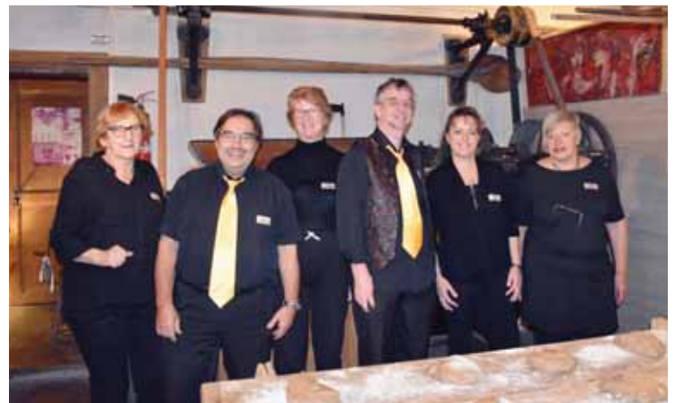
Sunny Gospel a fait un passage remarqué au Moulin Semblanet.

Renseignements: sunnygospel@romandie.com