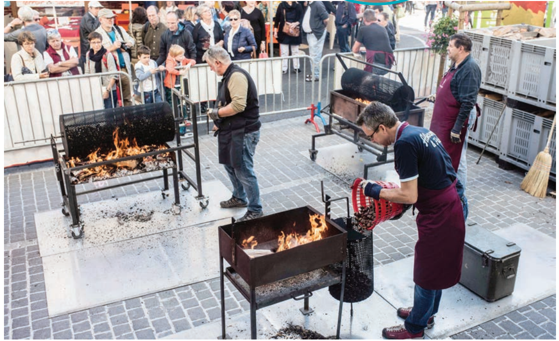
Des «brisoloirs» sont installés en nombre pour pouvoir rassasier quelque 40 000 visiteurs. LDD