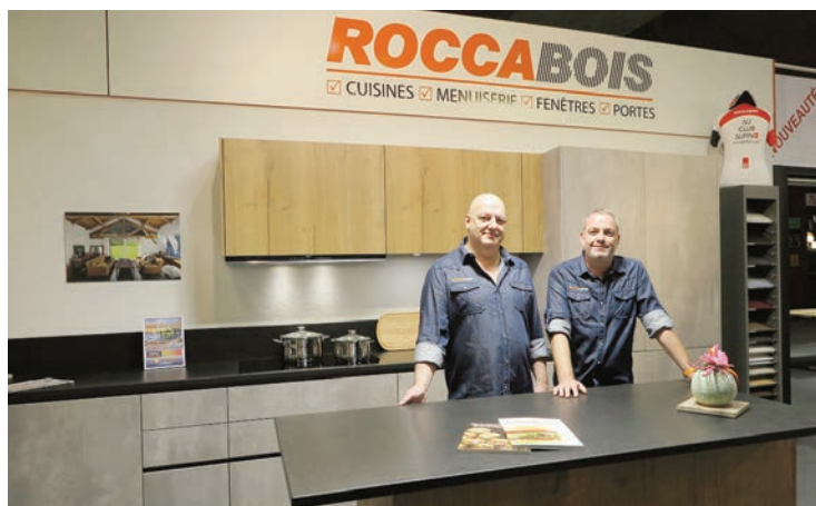
Roccabois. Stand 1103. Sans aucun doute les plus belles cuisines de la Foire ainsi que des nouveautés en fenêtres et agencement.