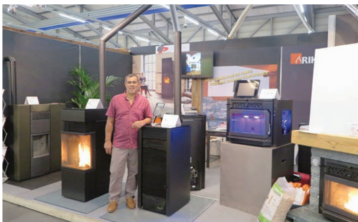
Fire Hi Tech SA. Stand 2232. Une technologie de pointe pour une chaleur confortable. www.inserts-valais.ch