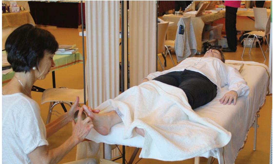
Sagesses d'ici et sagesses d'ailleurs » au Salon Synergie-Santé au Châble.