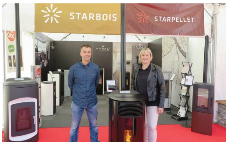
Starpellet Sàrl. Stand 215. Vous cherchez un four à pellets, il est chez Starpellet.