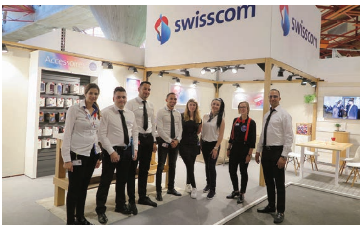
Swisscom. Stand 1608. Be happy, it's Swisscom Team ! Au stand No 1608, nous sommes prêts à vous accueillir et vous proposer nos offres spéciales Foire! Profitez de votre visite.