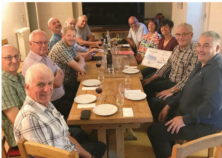
Les membres du Rotary Club Verbier Saint-Bernard tout heureux d'apporter leur soutien à l'ARFEC.