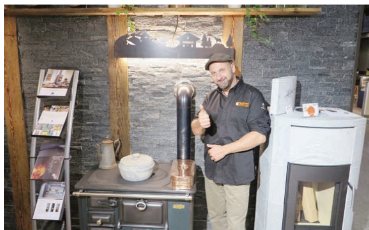
Pierre Tacchini Sàrl. Stand 1104. La tradition des fourneaux valaisans 100% pierre ollaire c'est chez nous! Super prix les bons plans de la Foire.