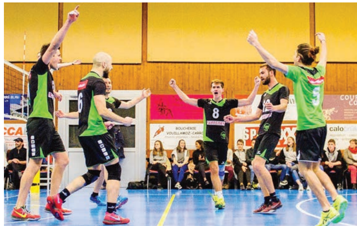
On va voir à l'œuvre des joueurs de haut niveau le 20 octobre à Martigny. STÉPHANE CONSTANTIN

MARTIGNY Le samedi 20 octobre prochain, deux équipes valaisannes néo promues joueront leur premier match à domicile en ligue nationale. Dès 16 heures, la 1re ligue masculine du Martigny Volley reçoit les Haut-Valaisans du VBC HOW, puis à 18 heures la LNB du VBC Fully affrontera les Bernois de Papiermühle. Pensionnaires de LNB depuis une année, ils se sont renforcés avec quelques joueurs de LNA avec comme objectif le sommet du classement. Du volleyball de haut niveau fera donc vibrer Octodure le temps d'un week-end.