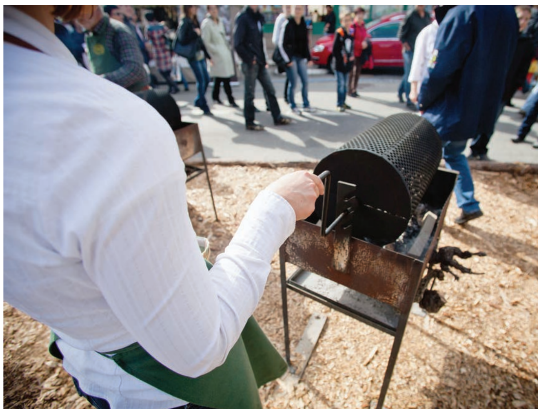
Quelque 15 tonnes de châtaignes seront grillées durant deux jours à Fully.

l'agitation du marché pour se ressourcer en forêt. Deux jours durant, la forêt de 17 hectares se transforme en un lieu d'animations et de sensibilisation à l'environnement. Le public, qui y est de plus en plus important, est invité à participer à de nombreuses activités «nature» et «famille», proposées gratuitement et les chanteurs du chœur des jeunes Flamme de Fully serviront une petite restauration», précise Alexandre Roduit.