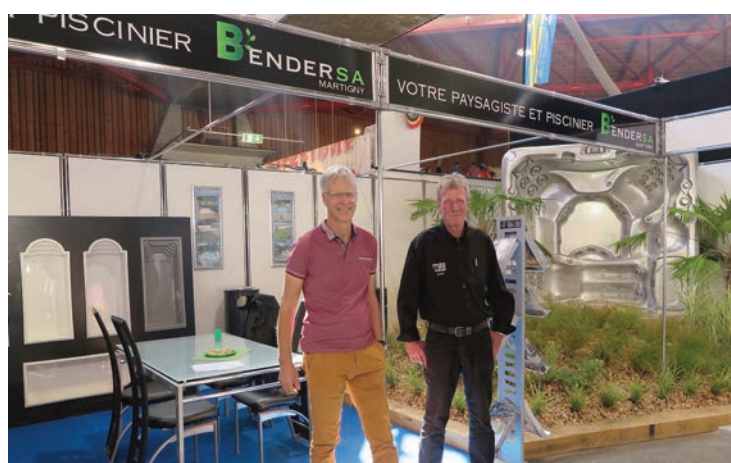
Bender Emmanuel SA. Stand 1809. Venez découvrir nos offres spéciales sur les piscines, les spas type Sundance, les jacuzzis ou pour tous vos aménagements extérieurs.