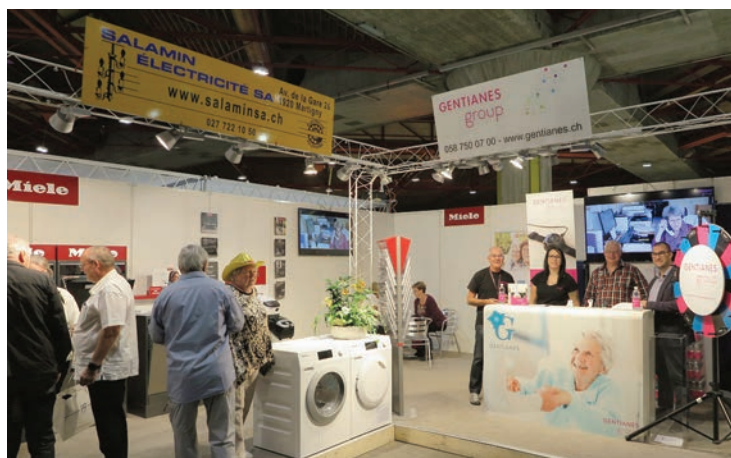
Salamin Electricité SA. Stand 1424. Présentation de machines à laver Miele. Gëntianes Group, solution d'appel à l'aide.