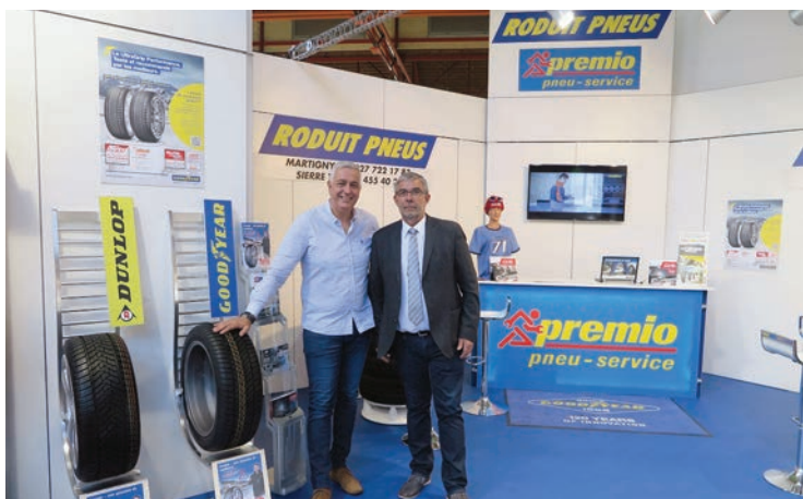
Roduit Pneus SA. Stand 1632. Venez découvrir nos promotions pour vos pneus d'hiver.