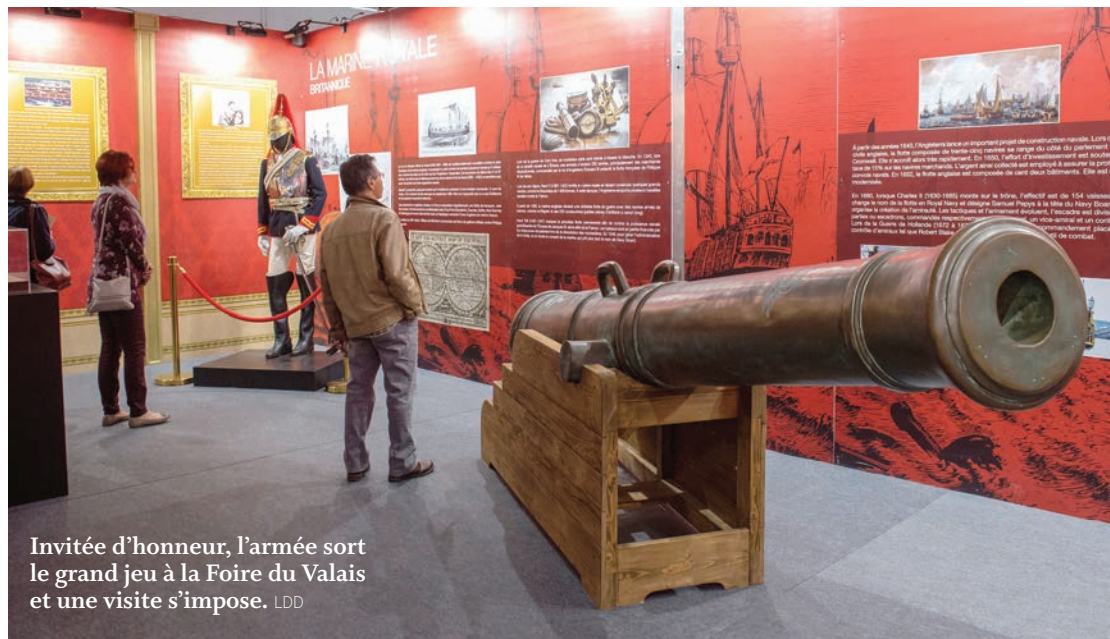
Invitée d'honneur, l'armée sort le grand jeu à la Foire du Valais et une visite s'impose.

Vous rendre sur notre stand, représentera l'occasion de découvrir un monde particulier, de pouvoir vous entretenir avec des mili-