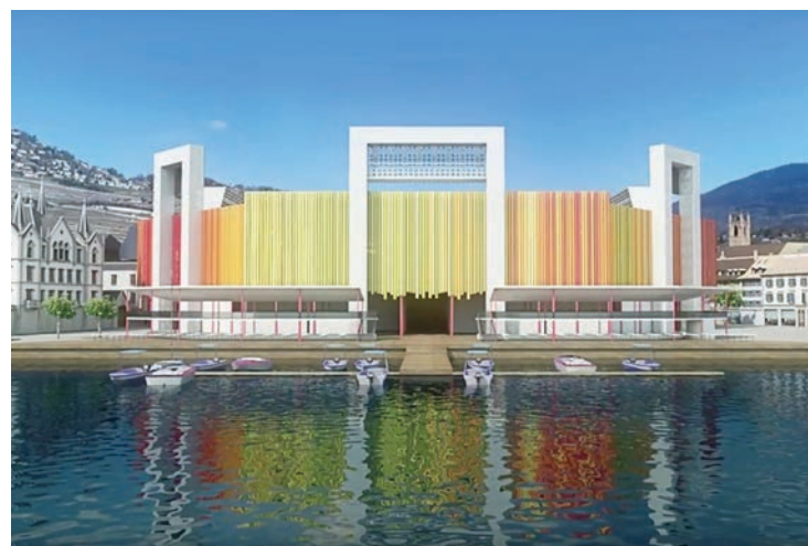
Le 6 octobre, les 50 ans de la SPVal seront officiellement fêtés. LDD

Une fois par génération, la Fête des vigneronns célèbre la vigne, une région et un art de vivre. Entre le