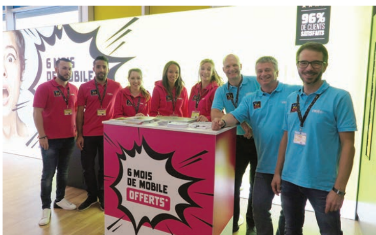
NetPlus.ch SA. Stand 2201. Offre stupéfiante de 6 mois sur le Mobile et 3 mois sur BLI BLA BLO ! Qui criera le plus fort son bonheur? Concours tous les soirs dès 18 h.