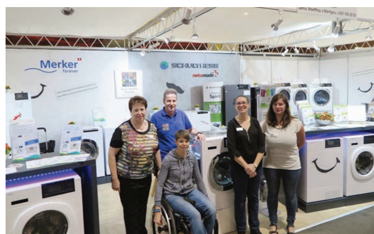
ABC Ménager Sàrl. Stand 1324. A votre service depuis plus de 50 ans. Offres attractives pour l'électroménager.