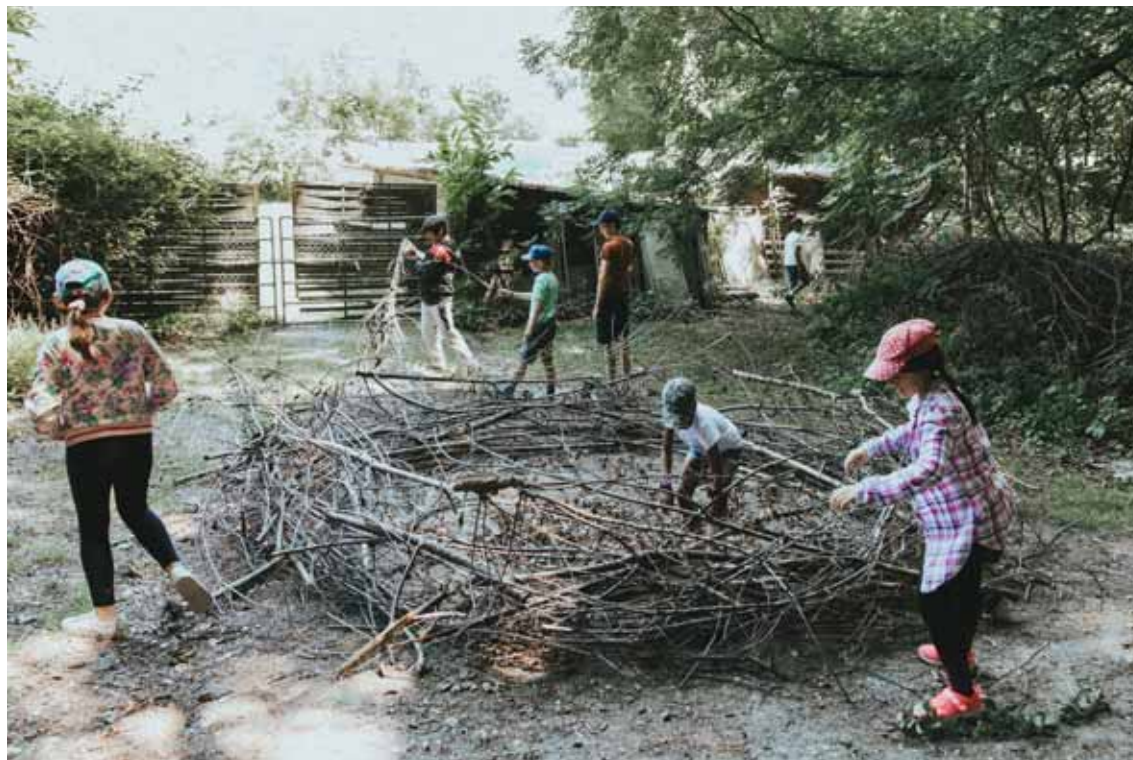
Des découvertes, de la créativité et du sport, il y en aura pour tous les goûts! LDD

Selon leurs envies, l'équipe d'animation organise différents ateliers en petits groupes, afin de réaliser leurs projets. Une formule qui permet à l'enfant d'être acteur ou actrice de son temps de loisirs et de développer des nouvelles compé-