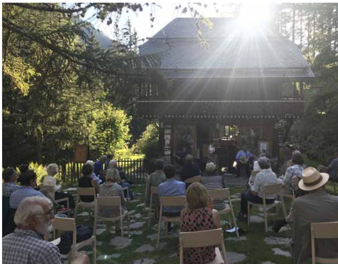
De nombreuses activités sont organisées au Jardin botanique de Champex, comme des concerts. LUCIENNE ROH