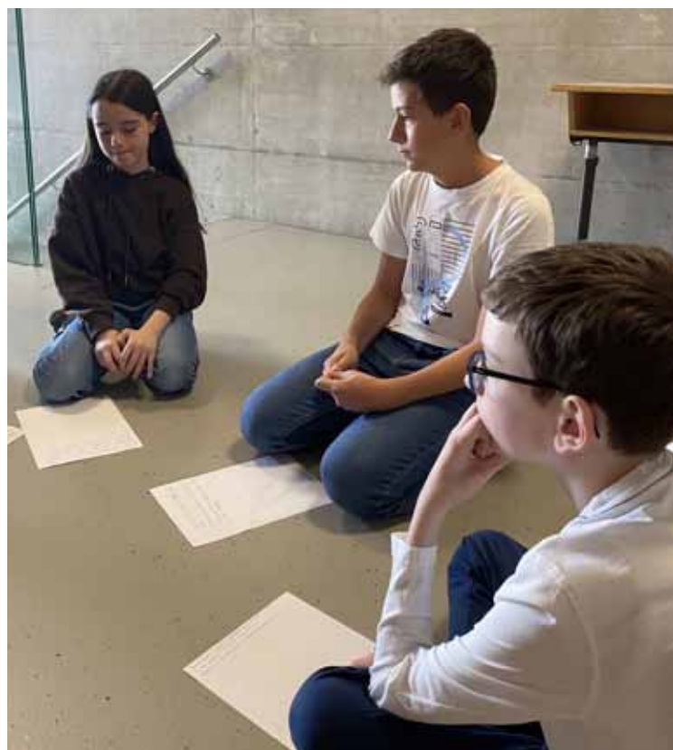
Attention, concentration et une belle expérience partagée par les élèves et les enseignants.

Dossiers pédagogiques en libre accès: https://hepvs.ch/films-graines-egalite Le site de Mélanie Pitteloud: https://melaniepitteloud.ch/