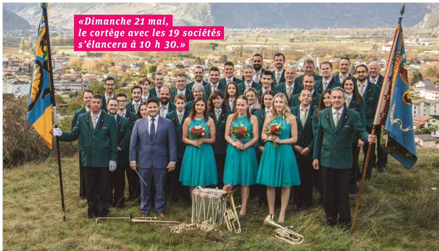
Le compte à rebours a démarré pour « L'Espérance » de Charrat qui organise le grand rendez-vous des fanfares démocrates-chrétiennes du Centre les 20 et 21 mai prochains. THOMAS MASOTTI