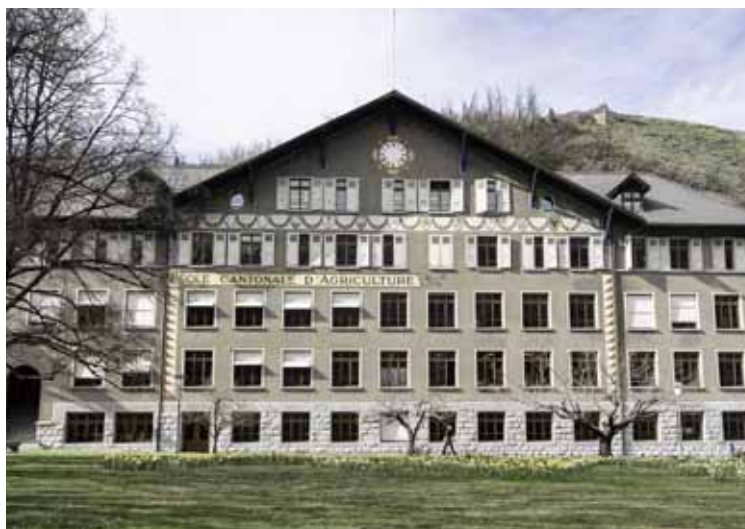
Le centième anniversaire est également l'occasion de se pencher sur l'avenir du site de Châteauneuf. LDD