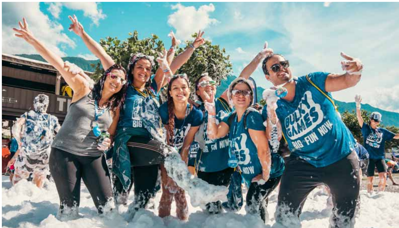
Le célèbre parcours d'obstacles gonflables revient dans le Valais avec deux dates, dont une réservée spécialement aux entreprises et un village de rencontre au CERM.