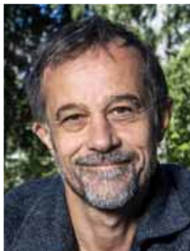
Après l'animation de «Ma vie de Courgette», le réalisateur valaisan Claude Barras actionne de nouveau des marionnettes pour son nouveau film, «Sauvages», une fable écologique.